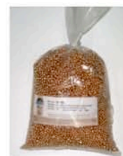
Sac de 5 kg