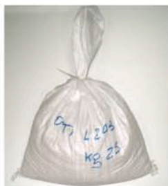
Sac de 20 kg