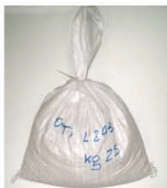
Sac de 20 kg