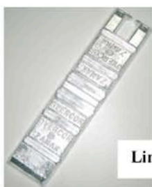
Lingot de Zamac