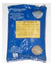
Sac de 2 kg