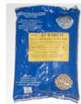
Sac de 2 kg