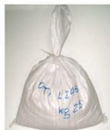
Sac de 20 kg